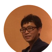
ケアチャネル・他