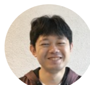
総務・ケアチャネル