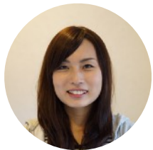
主任・言語聴覚士